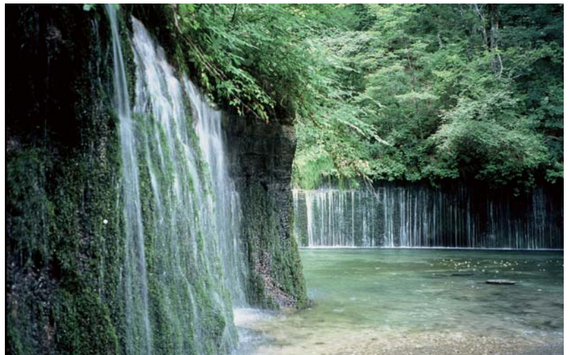
▲ 観光にも人気の白糸の滝。紅葉も美しい

アドバイス 適期は5月後半の新緑から10月の紅葉の時期。⑥三笠から小瀬、星野コースなどと組み合わせると三笠から旧軽井沢、星野から中軽井沢などへも出られる。