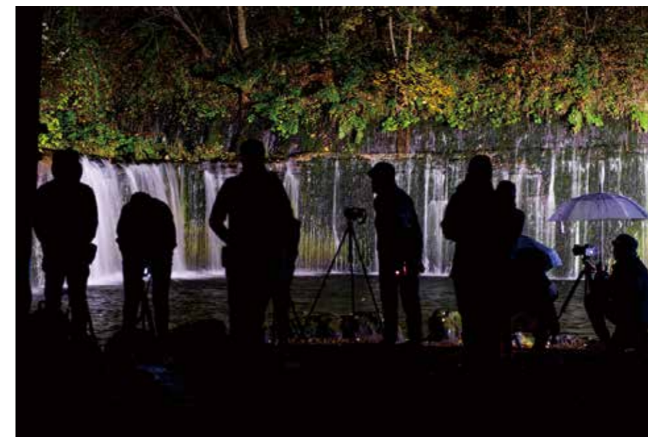
雨の夜のワークショップ、白糸の滝にて、2023年