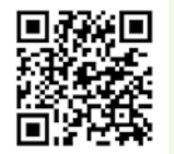
軽井沢観光協会 公式 HP