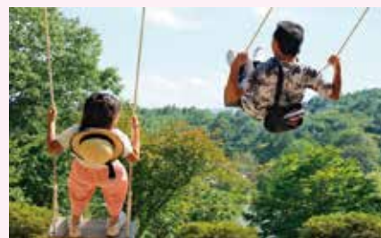
グランプリ じいじとヨロレイヒ〜森のブランコ〜