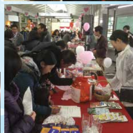
軽井沢駅通路での販売