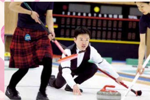
新郎によるファーストストーンショット