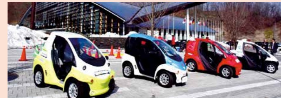
▲G7 軽井沢交通大臣会合 200日前イベント (次世代型電気自動車の展示も)