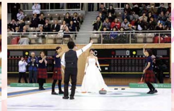
見事!ハウス中央に!