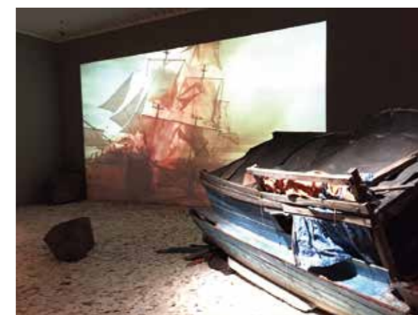
▲森美術館内展示の様子（アーバン型ミュージアム「森の美術館」）

（芳野）ミュージアムの基本は、普遍的な価値のある作品を紹介、保存することです。リゾートにあるからといって、その場をしのぐためだけの観光目録の内容を提案することではありません。軽井沢のような豊かな歴史を持つ