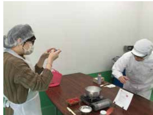
(体験型の誘客が増えている)