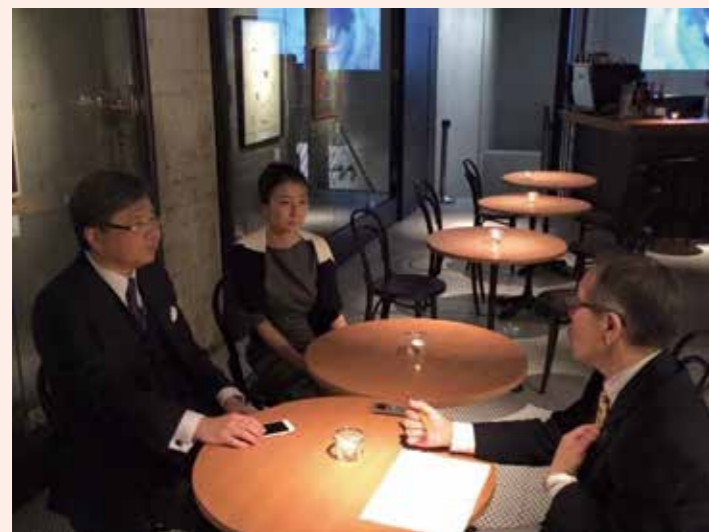
（取材場所：セゾンアートギャラリー）

長野は、国内において有数の「ミュージアム（博物館・美術館）」設置県といわれています。特に、法人や個人などが運営する私立の館が多く、観光地と称されるエリアへ集中していることも特徴です。各館は質の高い美術・芸術作品の企画展示もさることながら、モダンな建築デザインと洗練された空間を提供していることから、存在する地域に