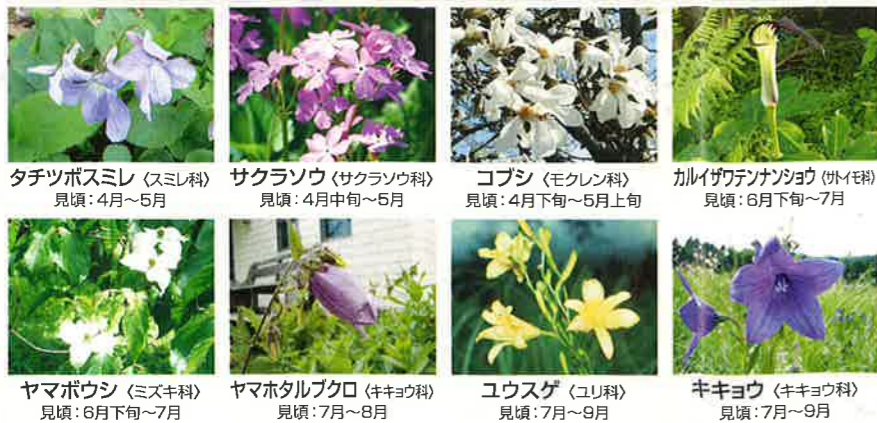
タチツボスミレ (スミレ科) 見頃: 4月~5月 サクラソウ (サクラソウ科) 見頃: 4月中旬~5月 コブシ (モクレン科) 見頃: 4月下旬~5月上旬 カレイガクテンナンショウ (オトメ科) 見頃: 6月下旬~7月 ヤマボウシ (ミズキ科) 見頃: 6月下旬~7月 ヤマハタルブクロ (キキョウ科) 見頃: 7月~8月 ユウスゲ (ユリ科) 見頃: 7月~9月 キキョウ (キキョウ科) 見頃: 7月~9月

標高約1,000mに位置する軽井沢には、数多くの山野草が分布しています。道端のお花も軽井沢の大切な景観の一部です。鑑賞して楽しんでください。